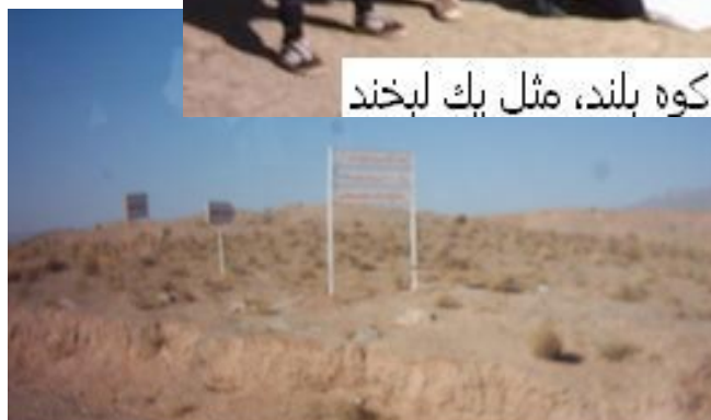
تابلو مرغداری محمدی