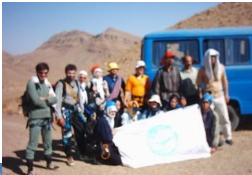
با سرود بی صدا، مثل یک کوه بلند، مثل یک لبخند

آخرین نقطه ای که با وسیله نقلیه می توان رسید (نیم ساعت قبل از دهانه غار)